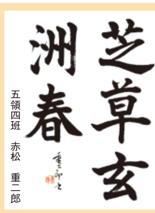
五領四班 赤松 重二郎